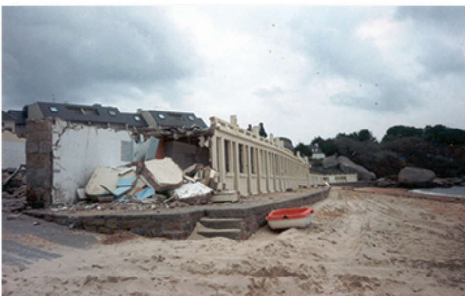
Cabines de bain