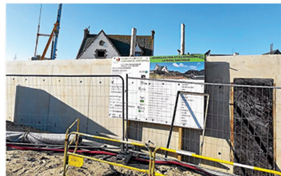
« Maison de la mer »