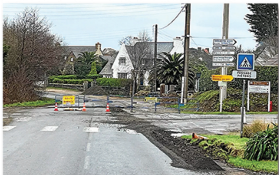
route de Trébeurden

Car, depuis fin 2024, les comptes dérapent avec d'importants dépassements de budget, notamment pour ces projets :